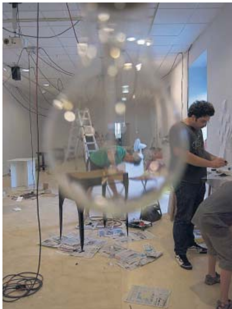
INSTALACIÓN. Está llena de bombillas que operan como neuronas.

tes que los responsables de van Dyck, como viene siendo habitual en estas exposiciones conmemorativas, rotarán durante las semanas que dure la exposición, alternando periódicamente el contenido de las obras expuestas.