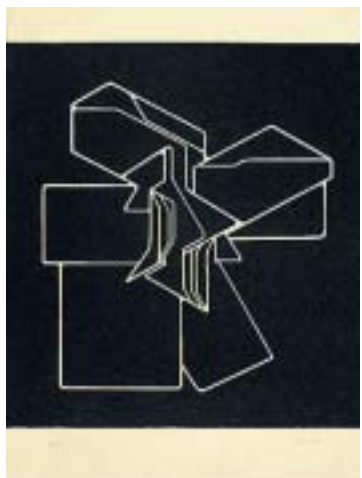
PALAZUELO. 'Bloom', aguafuerte y aguatinta.

blancas y negras se traducen como si fuesen auténticas partituras del silencio contenido. O Antoni Tàpies, que mantiene la estela de sus composiciones cuando se enfrenta a las dificultades derivadas del trabajo de estampación directa.