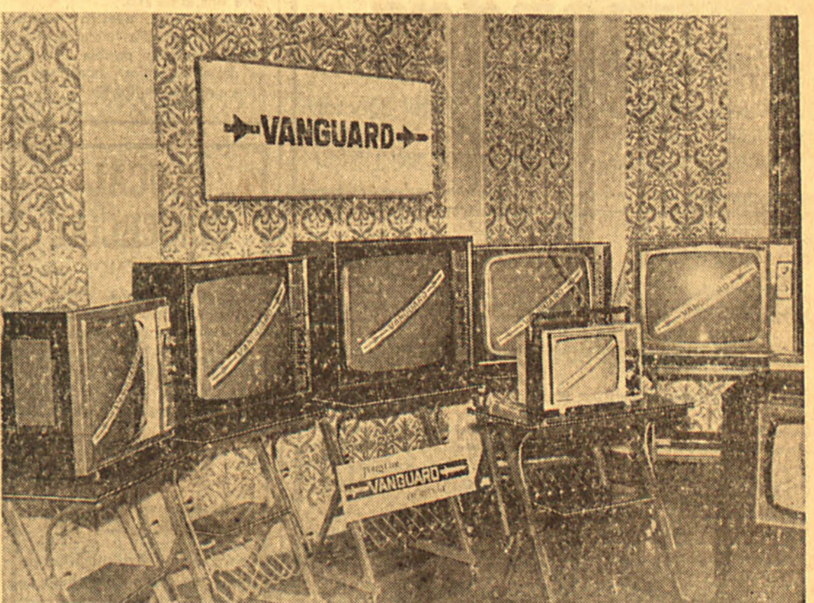
Vista parcial de la exposición de últimas novedades, presentada en la Convención TV. Vanguard.