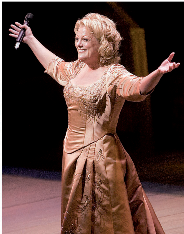
ANTES Y DESPUÉS. Deborah Voigt, en 2004, en una función de 'Las walkirias' en Nueva York. A la derecha, en la actualidad.