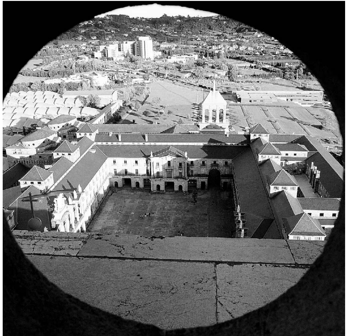
PRISMA. Patio de la Laboral visto desde una ventana de la torre.

La consejera de Cultura, Comunicación Social y Turismo fue más allá y recaló que, efectivamente, existen dineros suficientes para afrontar la construcción del Centro de Arte sobre la base de los talleres del espacio hasta ahora educativo, pero una vez levantado faltarán muchas cosas por hacer. «Un centro de estas características todos sabemos que necesita muchísimos recursos para funcionar con un mínimo de garantías», subrayó. De esta for-