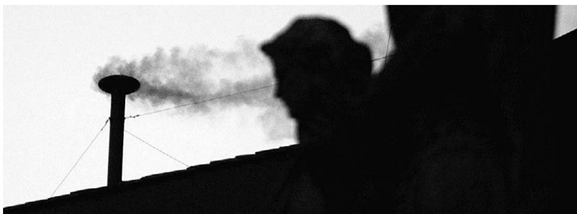
FUMATA. El humo negro de la chimenea, a contraluz, reveló que aún no hay Papa.

La votación que abrió el cónclave, como es tradicional, fue negativa, pero sirvió para delinear el primer esquema de candidatos y sus apoyos