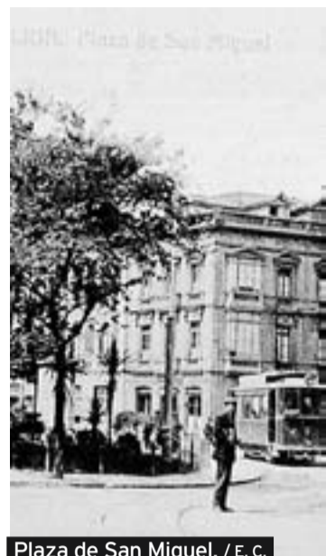
Plaza de San Miguel. / E. c.